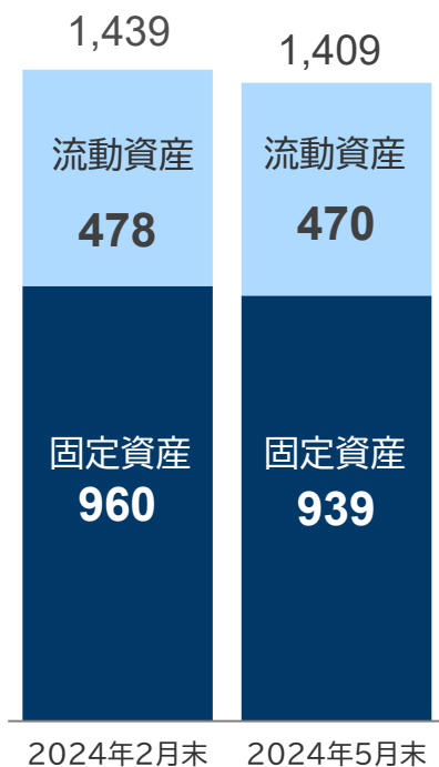
貸借対照表 (単位:億円)