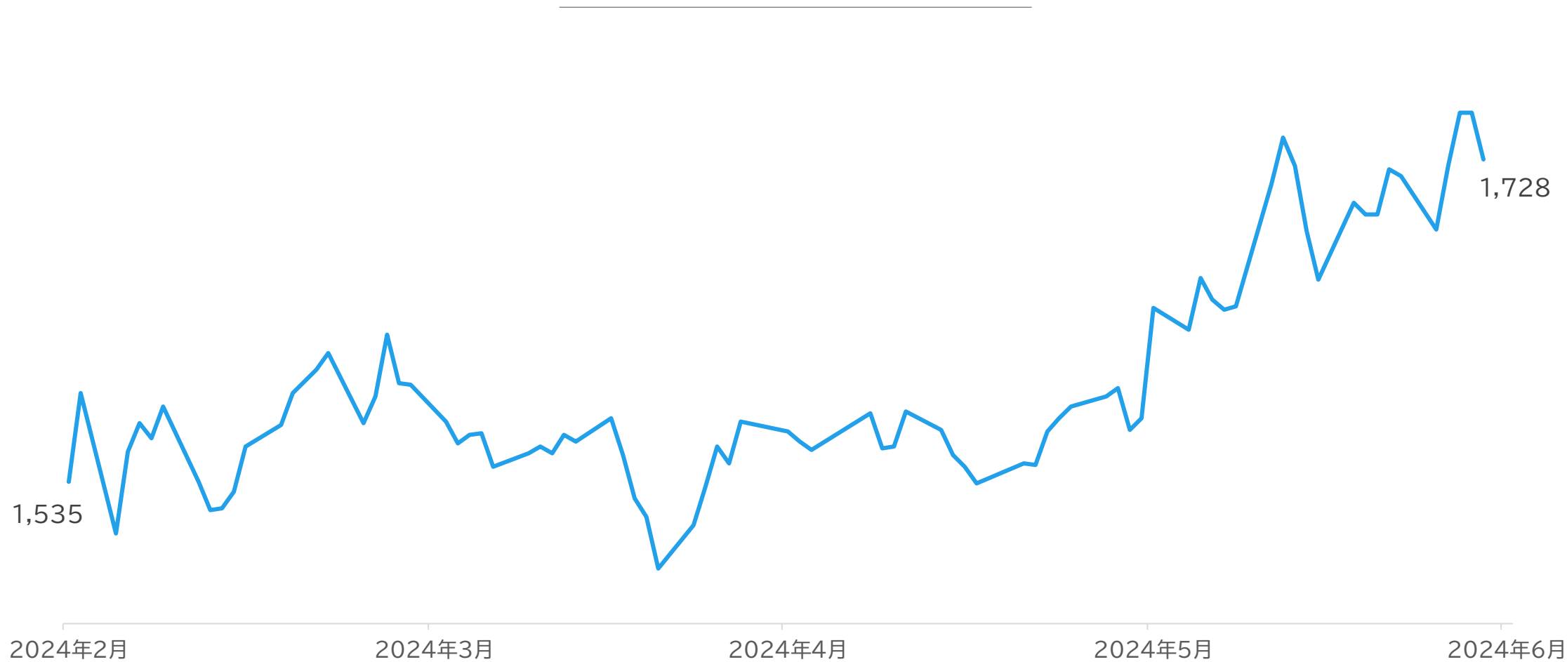
直近株価の推移 (単位:円)