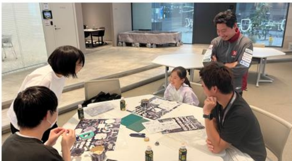
(CEO袴田が組立のアドバイスをする様子)