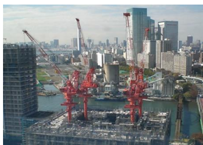
ジブクライミングクレーン