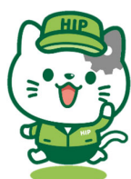
株式会社ヒップ マスコットキャラクター ヒップにゃん

本資料は、当社の企業説明に関する情報の提供を目的としたものであり、当社が発行する有価証券の投資を勧誘することを目的としたものではありません。また、本資料は2025年2月5日現在のデータ等に基づいて作成されております。本資料に記載された意見や予測等は資料作成時点の当社の判断であり、その情報の正確性、完全性を保証し、または、約束するものではありません。実際の業績等は様々な要因により大きく異なる可能性がありますので予めご了承ください。