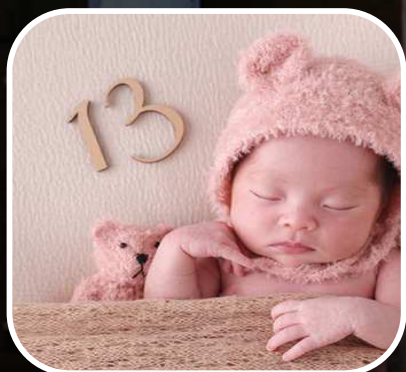
ニューボーンフォト