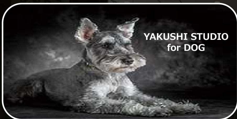
YAKUSHI STUDIO for DOG

■ LTVを重視し、人生に彩りを添える多彩なサービスメニュー (ライフタイムバリュー)