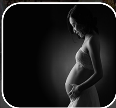
マタニティフォト